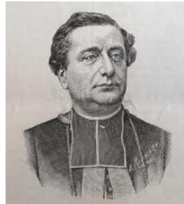
Mgr Turinaz, évêque de Nancy de 1882 à 1918