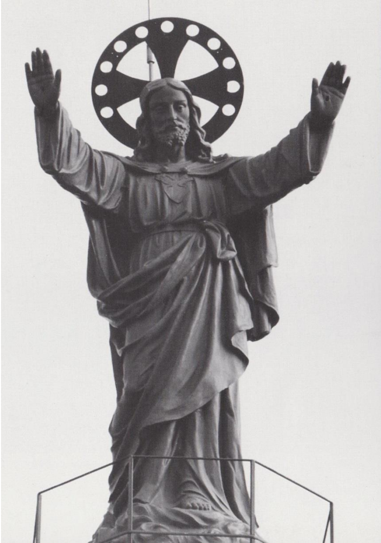
Statue du Sacré-Cœur dominant la coupole