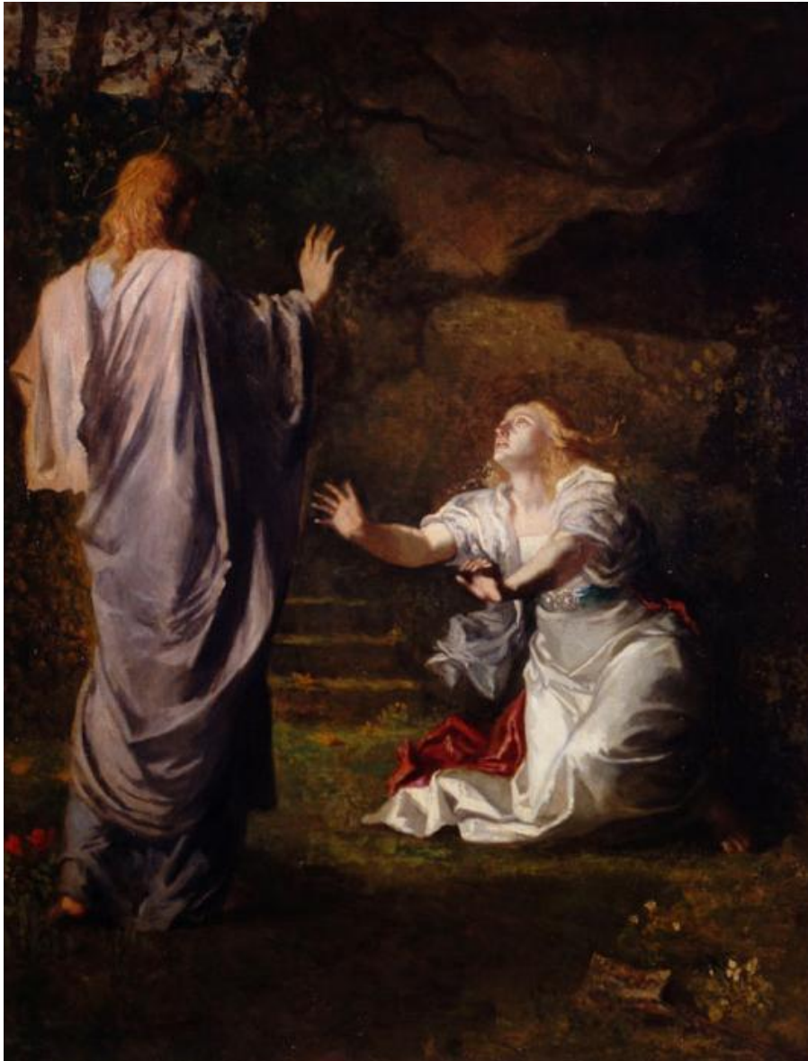
Un Noli me tangere très inhabituel avec Jésus vu de dos